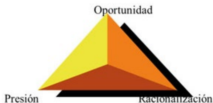
Figura 1. El triángulo del fraude

El triángulo del fraude tiene tres factores detonantes: