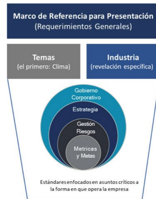
Figura 2. Arquitectura recomendada de los estándares sostenibles