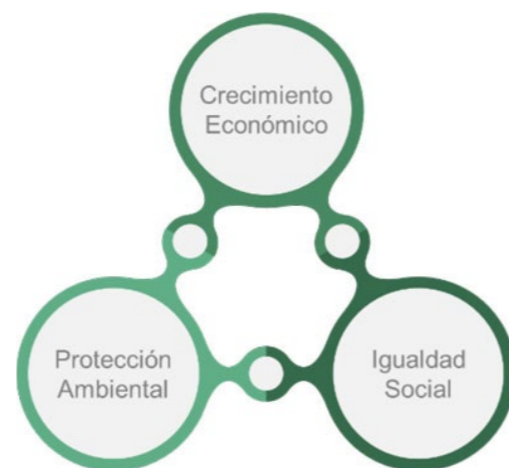
Figura 1. Desarrollo sostenible